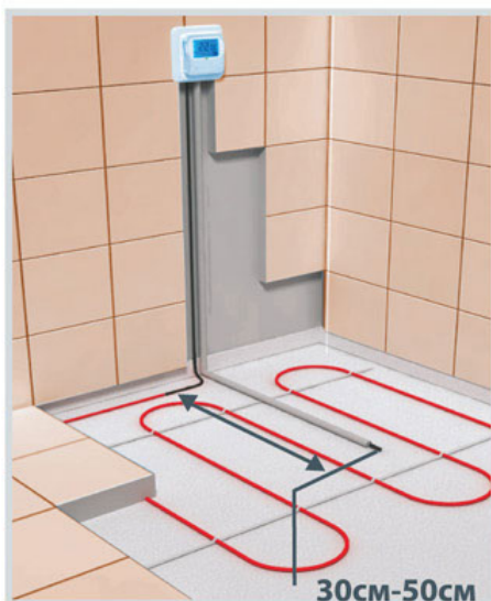
Схема укладки датчика температуры в гофрированной трубке