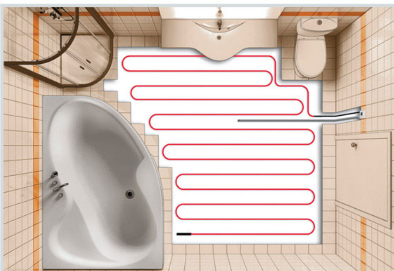
Схема укладки кабеля на свободную площадь